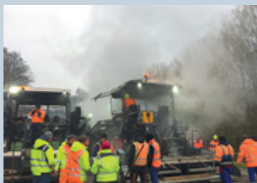
Standard Heißmischgut: 160 °C/Luft 5 °C