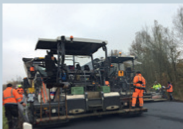
Temperaturabgesenkt: 140 °C/Luft 5 °C

Seit 1997 wird der viskositätsverändernde organische Zusatz SASOBIT erfolgreich für temperaturabgesenkte Asphalte eingesetzt. Dabei handelt es sich um ein Fischer-Tropsch-Wachs, welches fester Bestandteil im Regelwerk ist; siehe dazu unter anderem: